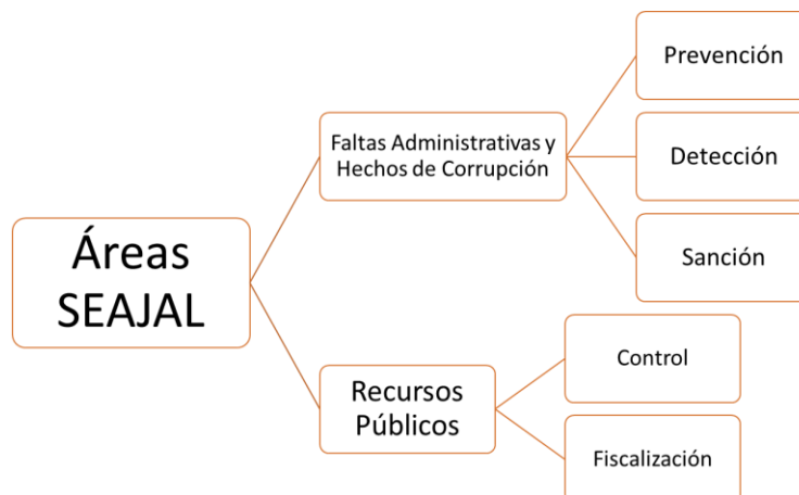
Figura 1 Áreas temáticas del Sistema Estatal Anticorrupción de Jalisco

El Sistema Estatal Anticorrupción del Estado de Jalisco (SEAJAL), es la instancia de coordinación entre las autoridades estatales y municipales competentes en la prevención, detección y sanción de responsabilidades administrativas y hechos de corrupción, así como la fiscalización y control de recursos públicos. Su finalidad es establecer, articular y evaluar la política pública anticorrupción de Jalisco, en armonía con la nacional, conforme lo establecido en el artículo 107 Ter, de la Constitución Política y artículo 5 de la Ley del Sistema Anticorrupción, del Estado de Jalisco (LSA).